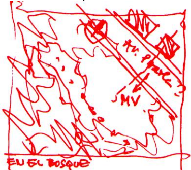
SITIO 2: Avenida P. Iraola, frente a la Guardería de la UNLP