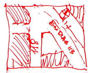
SITIO 3: Diagonal 113 esquina 118